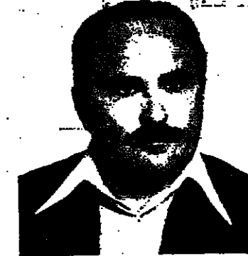
بقلم : شفيق منصور

المسألة : هل يمكن ان يكون هذا الموضوع واحدا من اهتمام الرأي العام العربي والوسط العربي والفرزي ، نظرا لنسبة كبيرة من البيوت قد شيدت في قرانا بدون ترخيص ، ومنع وصول هذه الخدمات الى تلك البيوت - يعني العودة بمواطيننا وقرانا عشرات السنين الى الوراء . ونظرا لاهمية هذا الموضوع واثره على تطور القرين العربية والفرزية فقد ناقشته الجلسة المحلية العربية والفرزية في اجتماع لجانها القطرية في القاهرة ، وكان تأثير في مركز السلطات المحلية ايضا عدا عن كونه احد سلم الانتصايات لسدي المسولين الحكوميين والفرزين في الاجتماعات العامة المختلفة .